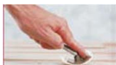
Dra verktyget mot dig