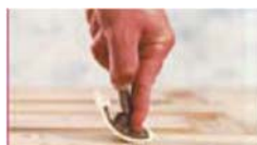
tills sektionen är klar.