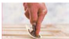
Tryck med pekfingeret

Rör om ZAR ® Oljebaserad Träbets ordentligt. Lägg på ett tunt slätt lager ZAR ® Träbets med en tygtrasa. Tryck med pekfingeret på verktyget mot den underliggande ytan. Vagga ner ådringsverktyget samtidigt som du drar det mot dig i en konstant hastighet. Vagga därefter fram och tillbaka samtidigt som du fortsätter att dra. Fortsätt tills ytan är klar. Det är viktigt att inte stanna upp. Om du gör fel är det ingen fara. Lägg bara på mer bets på ytan och ådra igen. Eller ta bort allt du har lagt på med en trasa fuktad med lacknafta och börja om.