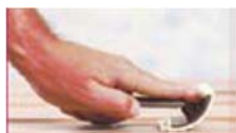
Vagga långsamt ner...