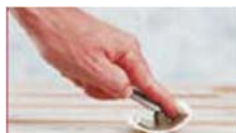
och upp, konsekvent,