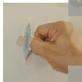
Dra av skyddsfilm